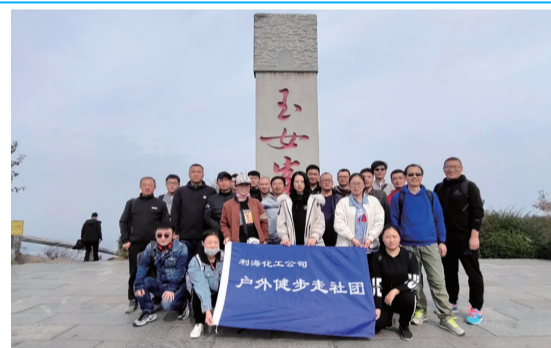
为丰富职工的企业文化生活,提升公司职工凝聚力和归属感,营造团结协作、和谐发展的团队精神。日前,利海化工公司工会在花果山景区举行了职工秋季登山比赛,50余名职工参加了比赛。(顾孟)