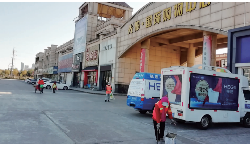
连日来，华茂裕欣公司在创文期间，针对开发区新交的 7 万平方米德兰光伸等商业店铺门面保洁任务，勇担重任，精心组织保洁人员，实行 13.5 小时连续不间断保洁，细化工作流程，有力保证了店铺的店面卫生。