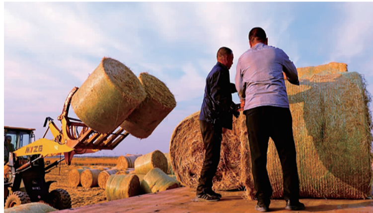
秋季农业收割期间，青口投资公司实施秸秆资源化综合利用项目，对 11000 多亩标准化农田范围内的秸秆清理打包。该项目既推动了农田保护和耕地质量提升，也减轻了禁烧压力，在促进环境保护上取得了良好成效，真正实现了“天蓝地绿空气新”。